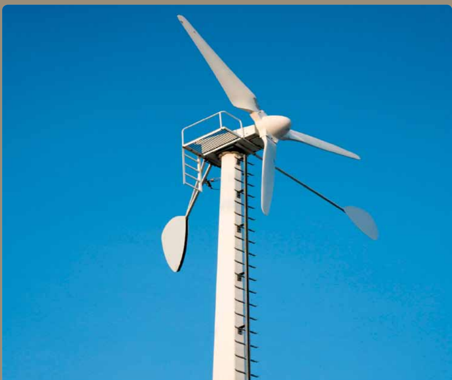
Statt Luft verschmutzen Windkraft nutzen.