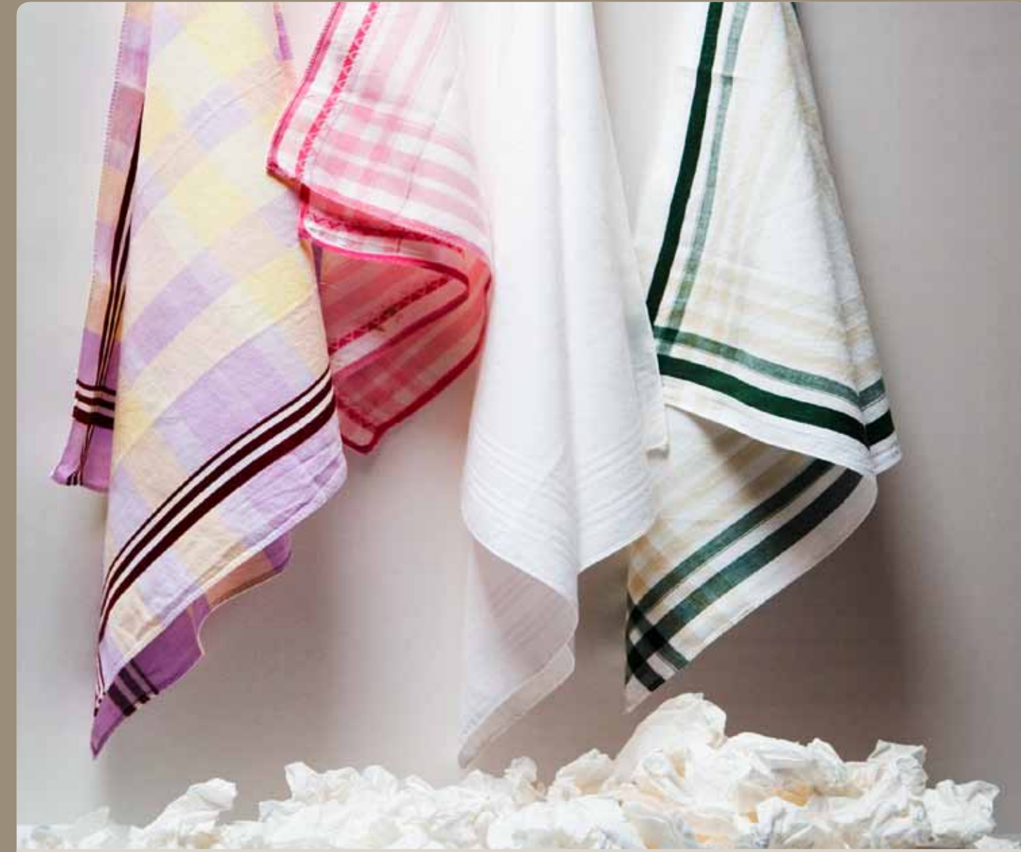
Wiederbenutzung statt Abholung.