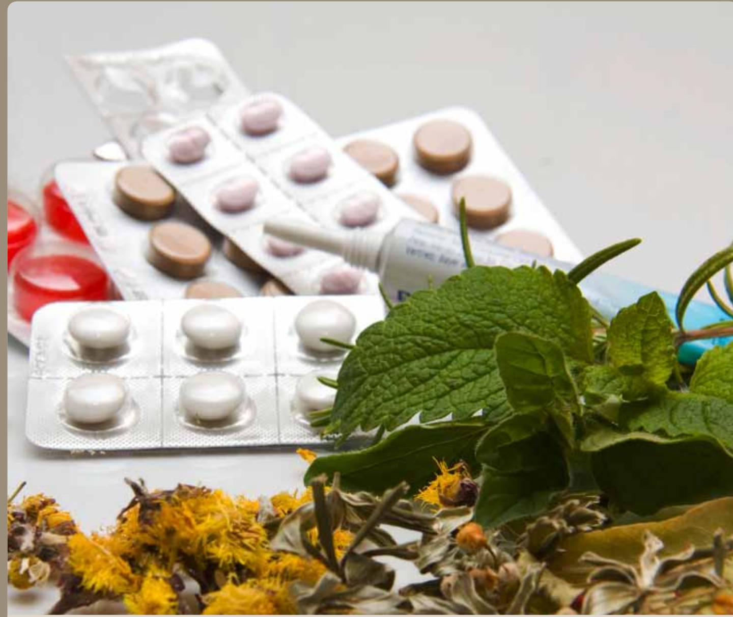
Gesundheit ohne Chemie.