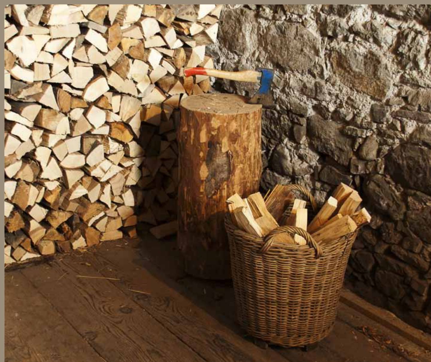
Fitness durch erneuerbare Energie.