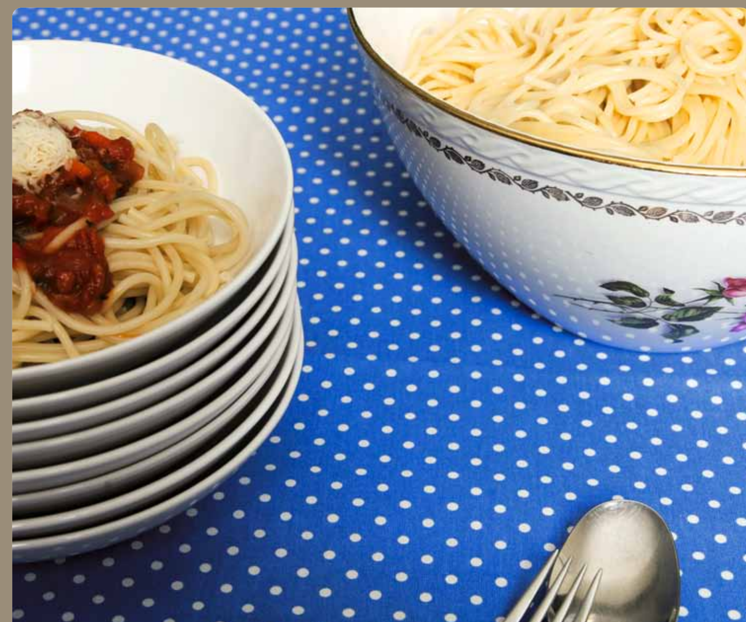
Mahlzeit. Gemeinsam essen tut gut.