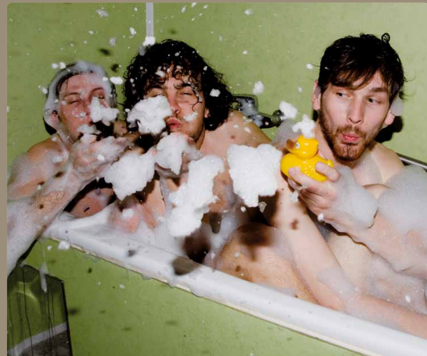
Mit einem Drittel Wasser den dreifachen Spaß erleben.