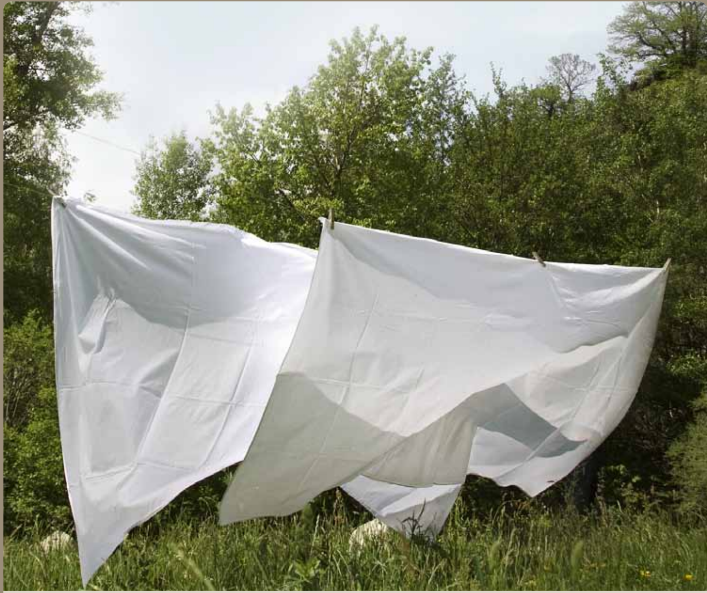
Reine Energie durch Wind.