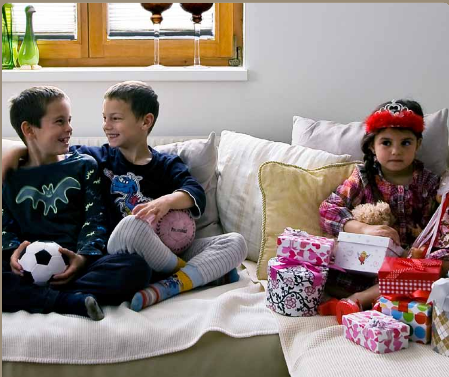
Freundschaften gelingen auch ohne Konsum.