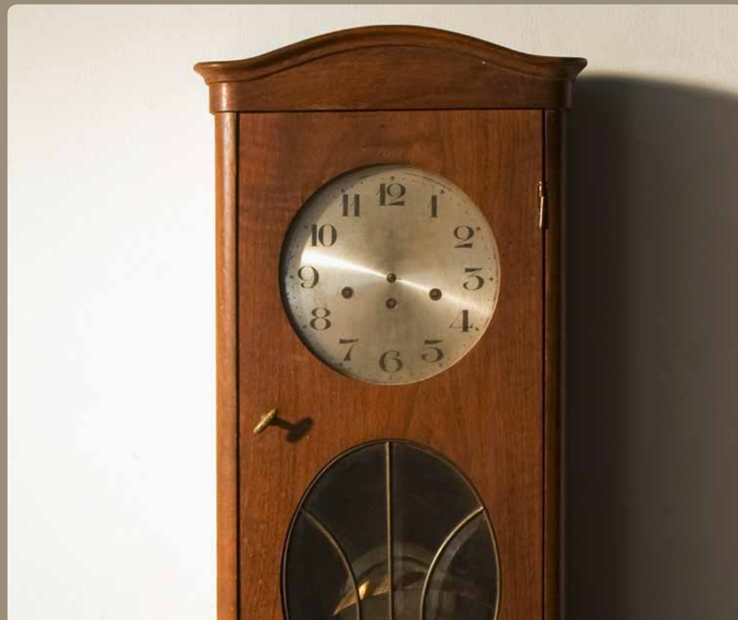
Zonen ohne Zeit schaffen.